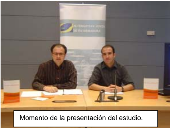
Momento de la presentación del estudio.

La gran mayoría de los encuestados aprueban con notable sus estilos de aprovechar el tiempo libre, aunque más de la mitad de ellos demanda a sus respectivos ayuntamientos una mayor presencia de espectáculos en la calle, según ha indicado el estudio.