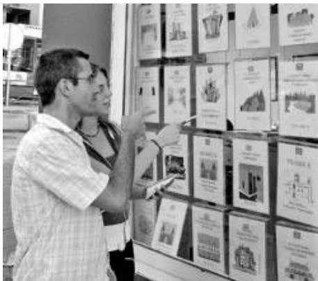
Dos jóvenes consultan los carteles de una inmobiliaria en la región.

La vivienda y el desempleo son las principales preocupaciones para cinco de cada diez jóvenes extremeños, que señalan ambas cuestiones como la causa que les impide desarrollar sus proyectos del vida futura, según el informe elaborado por la organización Alternativa Joven durante los meses de febrero y marzo del 2007 y en el que han participado 1.000 jóvenes de entre 17 y 26 años de toda la región. Según este estudio, cuestiones como el terrorismo o los accidentes de tráfico también